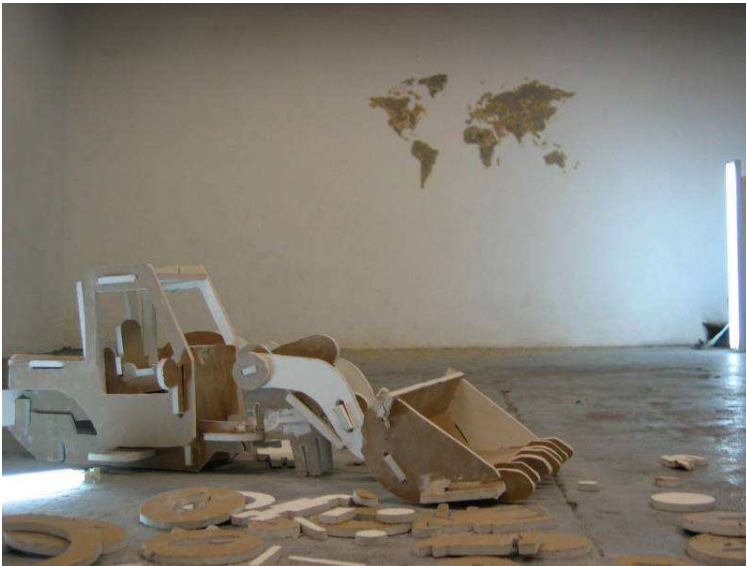
Jean Denant, Se nourrir sur la bête , Galerie ALaPlage, Toulouse, 2006