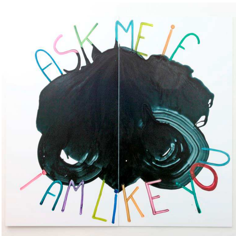
Dominique Figarella, sans titre, 2008, peinture sur aluminium, 150 x 200 x 1 cm