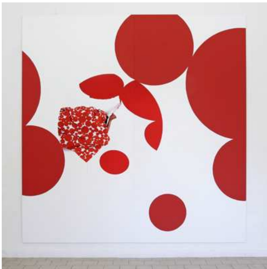
Dominique Figarella, sans titre, 2008, tirage numérique et peinture sur aluminium, 304x300x1cm