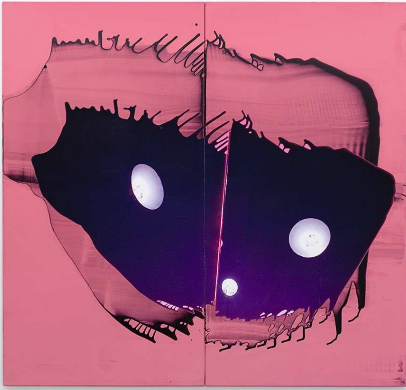
Dominique Figarella, Qui est ? , 2004, tirage numérique, peinture sur aluminium, 200 x 220 cm, Collection le musée de Sérignan